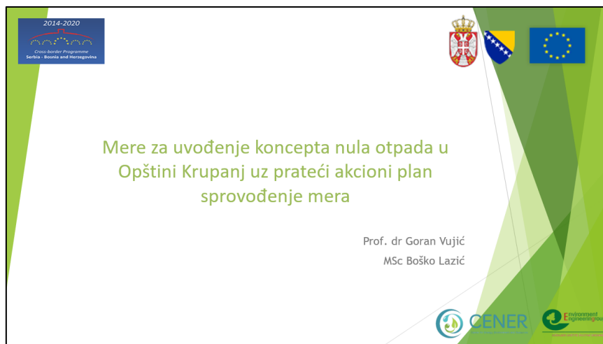
Slika 1. Prezentacija sa sastanka sa Opštinom Krupanj 1

U toku procesa kreiranja ovog dokumenta, sprovedeni su interaktivni sastanci sa predstavnicima Opštine Krupanj i javnim komunalnim preduzećem JKP „1. Maj“ iz Krupnja, kao i predstavnicima udruženja Inženjeri zaštite životne sredine iz Novog Sada (Srbija). Tokom sastanaka predstavnici su davali mišljenje kao i određeni predlozi u vezi definisanja mera za uvođenje nula otpada. Sastanak je održan 04.02.2022. godine, tokom kojeg su Eksperti predstavili osnovne ciljeve, kao i sadržaj dokumenta. Pored toga tokom sastanka definisane su glavne obaveze predstavnika, ključni izazovi, kao i načini na koje se isti mogu prevazići. Predstavnici su jasno izjavili da su saglasni sa predloženim sadržajem dokumenta te će nastojati da u budućnosti aktivno budu uključeni u realizaciji seta mera i strategija iz ovog dokumenta. Na narednim slikama (Slika 1. i Slika 2.) mogu se videti isečci prezentacije sa sastanka.